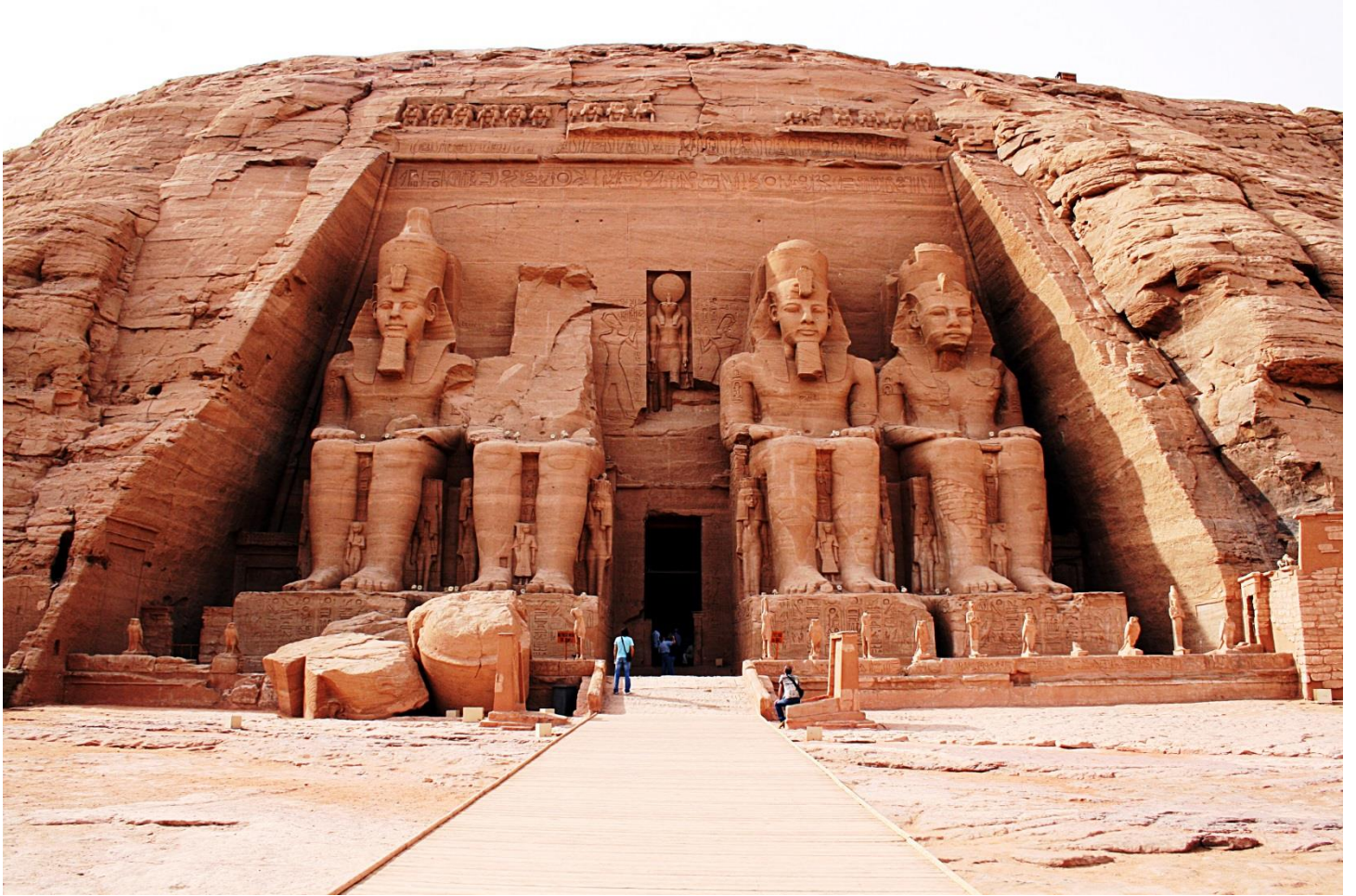
IMAGEN 7: Templo de .....