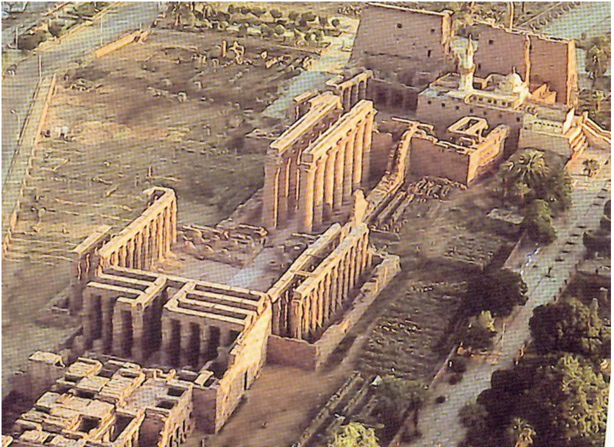
IMAGEN 6: Templo de .....